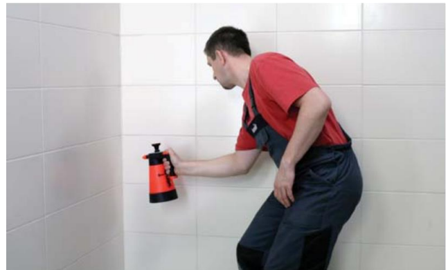
Vastatäytetyn sauman kostuttaminen saippuavedellä

Viiden minuutin ajan on täytetylle pinnalle ruiskutettava saippuavettä ja tasoittaa pinta kostealla työvälineellä, poistaen samalla ylimääräiset materiaalit.