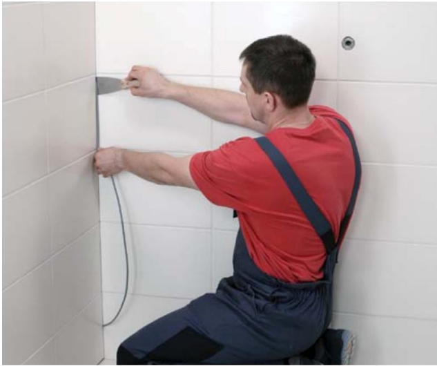
Saumanarun asentaminen sauman sisään