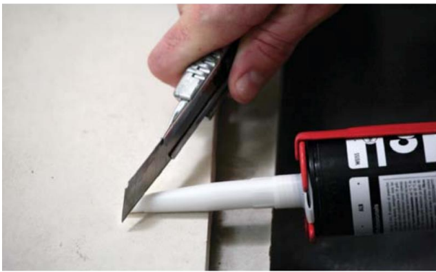
Annostelijan leikkaaminen sopivan levyiseksi

Tuubin kärki leikataan kierteen kohdasta. Kiinnitetään annostelija, joka leikataan täytettävän sauman leveyden mukaisesti.